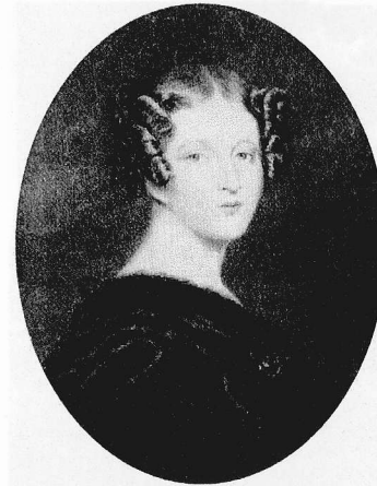
Catherine în jurul vârstei de douăzeci și unu de ani; după o gravură de Alfred Edward Chalon.